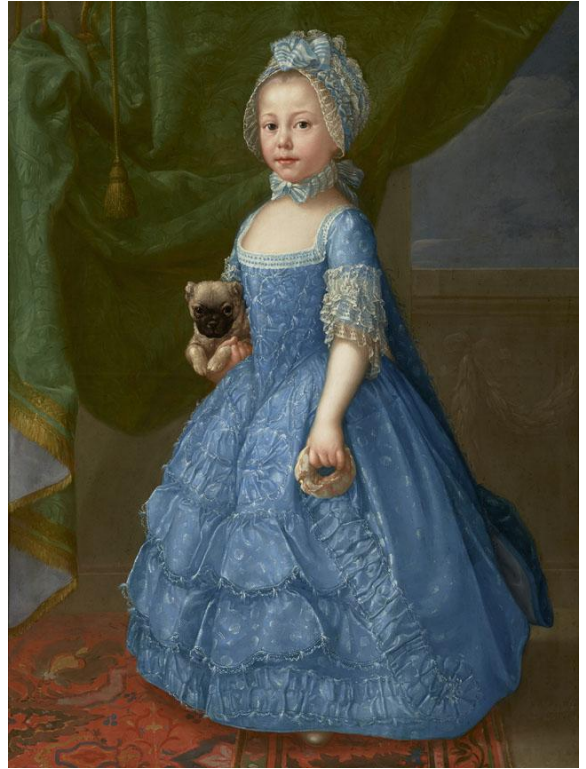
Francisco Bayeu. Retrato de María Teresa del Castillo . Hacia 1767-1770. Óleo sobre lienzo. 116 x 88 cm. Meadows Museum, Dallas.

Francisco Bayeu's Study of a Dog from Life , editado por el Centro de Estudios Europa Hispánica en colaboración con la Spanish Gallery de Bishop Auckland, es un libro delicioso, pero también un pequeño tratado científico sobre una obra más que ha dejado nuestro país y que pertenece a la mejor tradición española de la pintura. No en vano el autor enseña la especial relación de esta pintura con Velázquez, con cuyo arte relaciona el modo y estilo del perro.