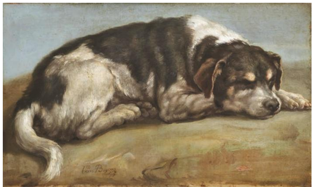
Francisco Bayeu. Study of a Dog from Life . Hacia 1783-1784. Óleo sobre lienzo. 43,3 x 72,7 cm. Spanish Gallery, Bishop Auckland.