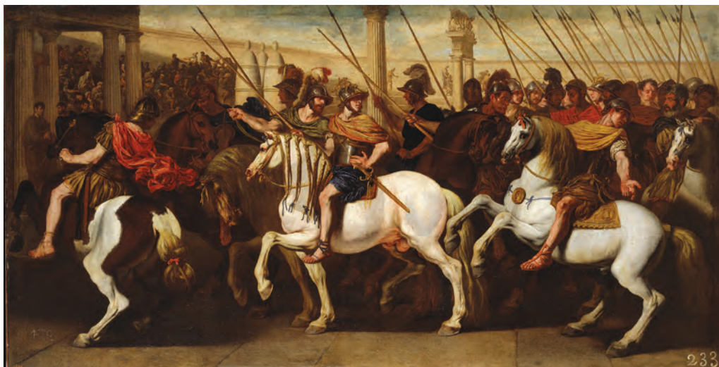
ANIELLO FALCONE, Entrada de los soldados romanos en el Circo . Hacia 1640. Óleo sobre lienzo, 92 x 183 cm. Madrid, Museo Nacional del Prado.

La norma oratoria establecía que en el «capítulo de la crianza» el rétor o el poeta deberían referir «si [la figura elogiada] se crió en palacio, si de púrpura fueron sus pañales, si desde su primera infancia se crió en regazo real; o no así, sino que fue elevado al trono en su juventud por algún feliz suceso. [Siendo obligatorio resaltar si ha] tenido una crianza ilustre, como Aquiles junto a Quirón» 64 . Los autores tardoantiguos tenían bien aprendida la lección oratoria, de modo que no resulta difícil encontrar ecos de este consejo del basilikòs lógos en la poesía del Bajo Imperio 65 .