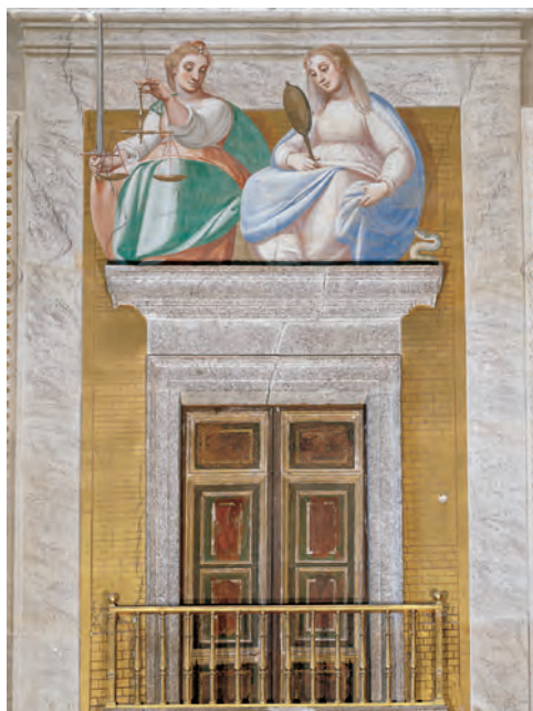
LUCA CAMBIASO, Justicia y Prudencia . 1585. Fresco. Basílica del Monasterio de San Lorenzo de El Escorial.

necesario postular otro eco literario identificable con el magisterio de este escritor alejandrino 83 . Me refiero al uso de quince personificaciones alegóricas presentes en el elogio del duque. En efecto, a lo largo de todo el Panegírico Góngora iría sutilmente disseminando una serie de figuras estilizadas que conviene ahora recordar (vv. 25-28, 151-168, 189-192, 199-200, 201-203, 213-216, 265-269, 271-272 y 361-364, 389-392, 415-416, 469-471, 493-494, 525-528):