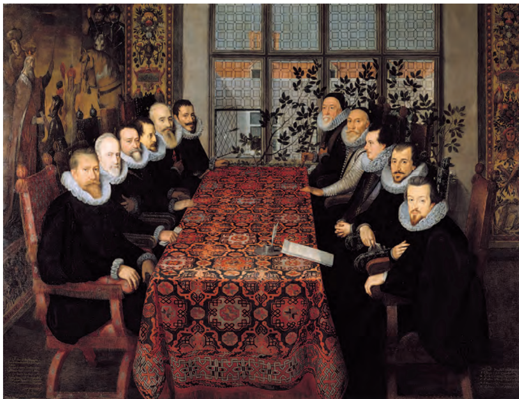
ANÓNIMO, La Conferencia de Paz de Somerset House . 1604. Óleo sobre lienzo, 205 x 267 cm. Londres, National Portrait Gallery.

rísticos (el bastón ornado con una pareja de serpientes): «varón, cuya mano grave / alternando instrumentos persuada / o con el caduceo o con la espada» (vv. 598-600), «el de sierpes al fin leño impedido» (v. 605).