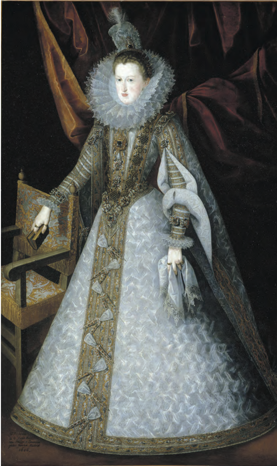
2. JUAN PANTOJA DE LA CRUZ, Margarita de Austria . 1606. Óleo sobre lienzo, 204 x 122 cm. Madrid, Museo Nacional del Prado.