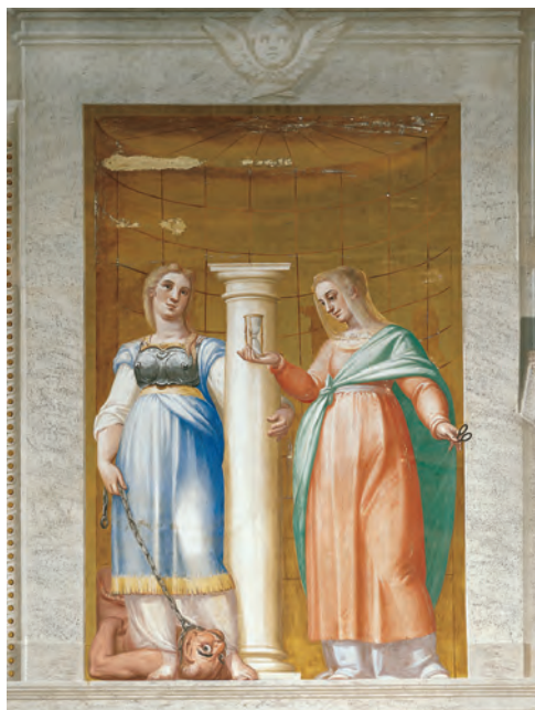
LUCA CAMBIASO, Fortaleza y Templanza . 1585. Fresco. Basílica del Monasterio de San Lorenzo de El Escorial.